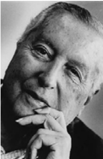
Ilya Prigogine (1917-2003)